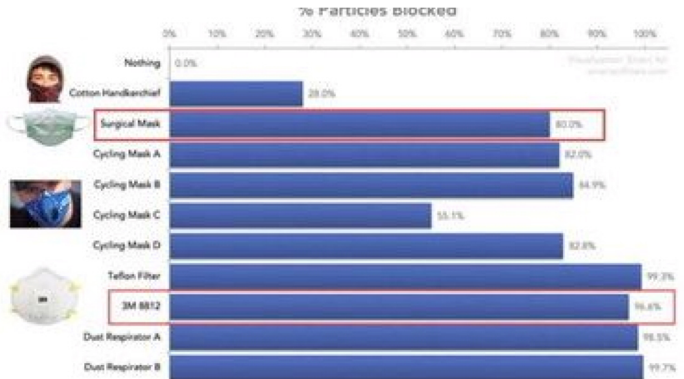
Langrish, Jeremy P., et al. "Beneficial cardiovascular effects of reducing exposure to particulate air pollution with a simple facemask." (2009).